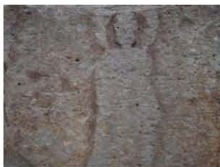
←石造遺物（塔身）の阿弥陀如来像

本展示を見たうえで金沢城についてみられれば、また違った視点でお城を眺められるのではないかと思います。ぜひ一度、本企画展に足をお運びください。