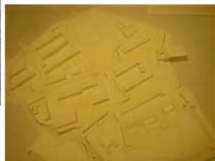
→金沢大学城内整備計画模型