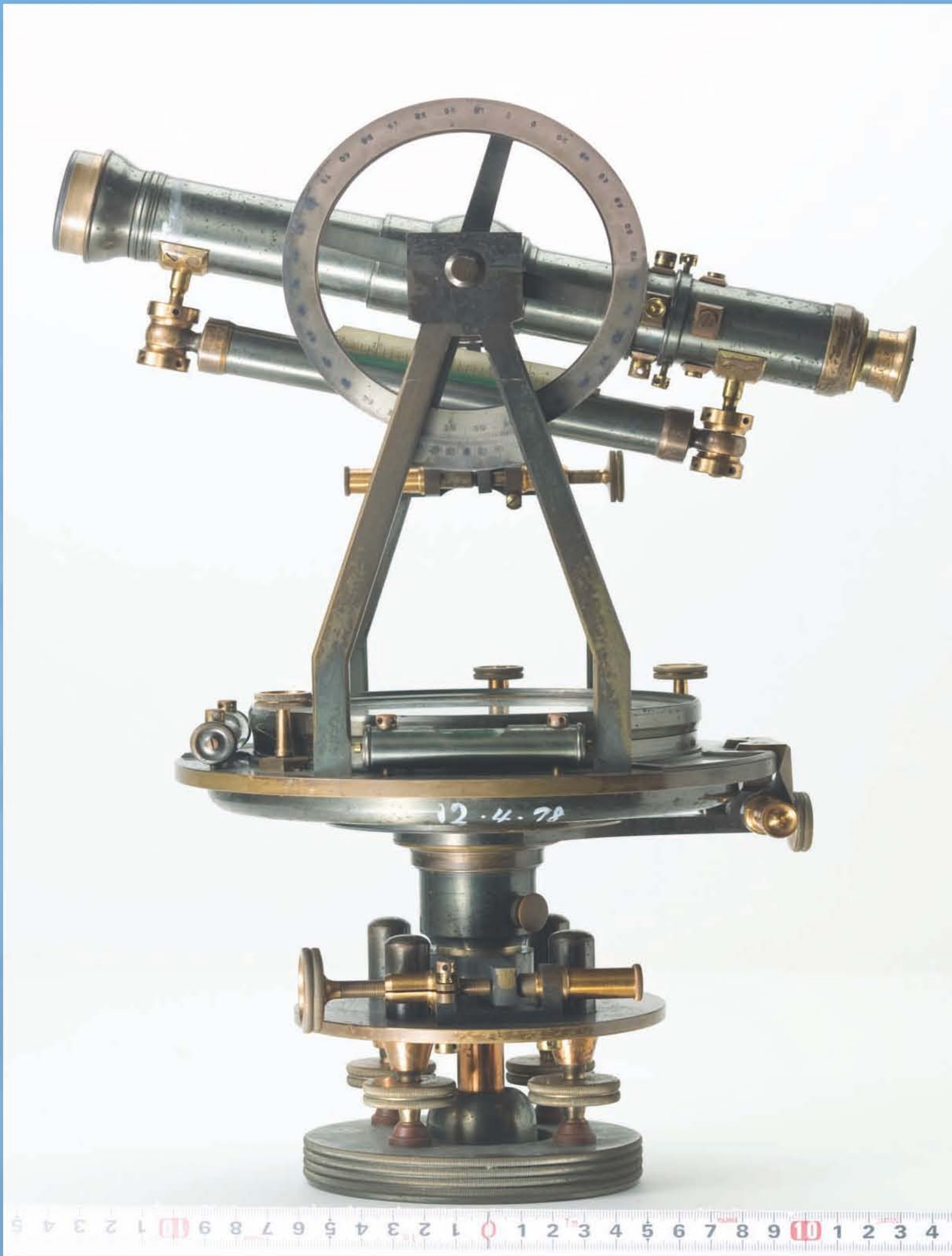
経緯儀 (重学302) 金沢大学資料館所蔵